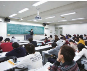
※研究室は2024年度のもので、2025年度は変更になる場合があります。